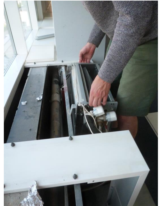
Foto's genomen tijdens het plaatsbezoek