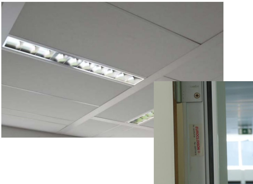
Foto's van de plafondelementen en lichtarmaturen en van de binnenwanden van Eurocloison