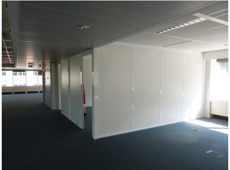
Foto's genomen tijdens het plaatsbezoek